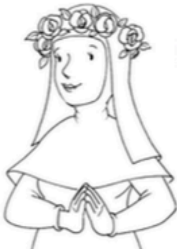
Santa Rosa de Lima