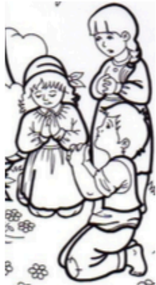
Pastorcitos de Fátima