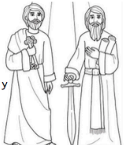
San Pedro y San Pablo